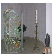
Taufstein - Eisengitter