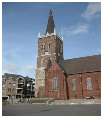
Unsere Pfarrkirche St. Peter und Paul

Schon seit einigen Monaten stand dieser begehrte Termin fest und 21 Anmeldungen lagen vor. Von unserem Präses wurden wir herzlich empfangen und dann begann auch schon die Führung. Die Hauptpfarrkirche St. Peter und Paul ist die größte Kirche in Eschweiler. Sie liegt an der Nordseite des Marktplatzes und ist ein Wahrzeichen der Stadt und ist eine der ältesten Kirchen im Bistum Aachen. Ganz erstaunt waren wir aus der Historie zu hören das die Kirche ursprünglich „Sankt Michael“ hieß und später irgendwann umbenannt wurde. Wahrscheinlich entstand die Kirche aus der Hofkapelle des ehemaligen karolingischen Königsgut „Fundus Regius Ascvilare“, welches 828 erwähnt wurde. Von der ursprünglich im romanischen Stil erbauten Kirche steht nur noch der untere Turmbau aus dem 14. Jahrhundert.