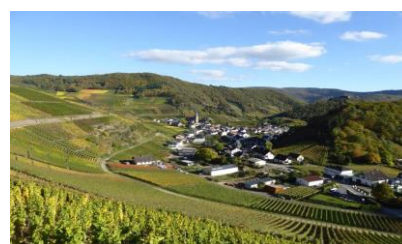
Weinberge bei Mayschoß