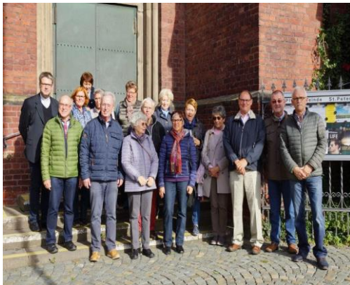
Teilnehmer der Kirchenführung