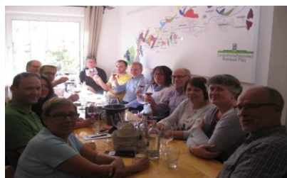
Vorstandsmitglieder bei der Weinprobe

Die Vorstandsmitglieder bedanken sich bei ihrem Präses für die sehr gute Organisation und vor allem, für den schönen Tag mit ihm an der Ahr.